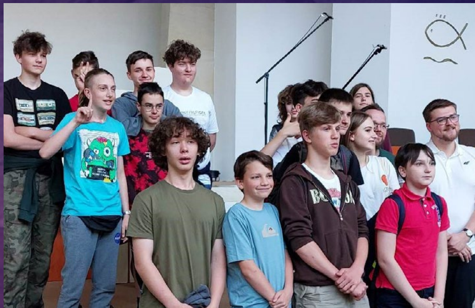
Zdjęcie Wycieczki Szkolnej w Kaplicy Zboru