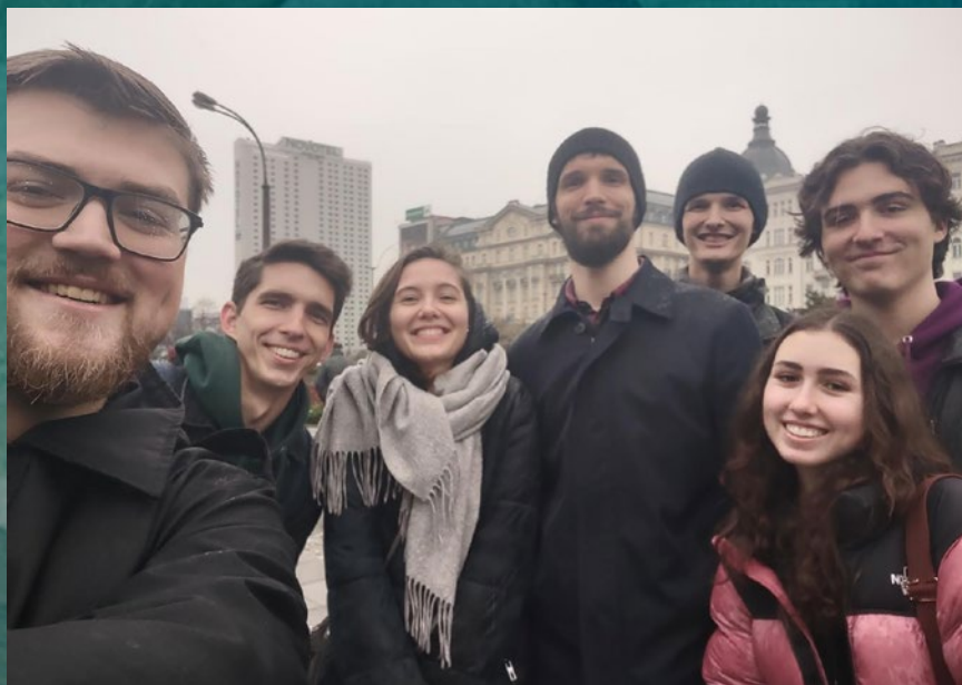
Grupa ze zboru na ewangelizacji ulicznej w dniu 5.11'22