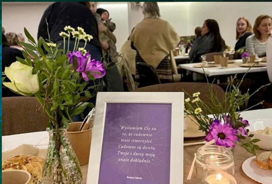
Marcowe spotkanie kobiet