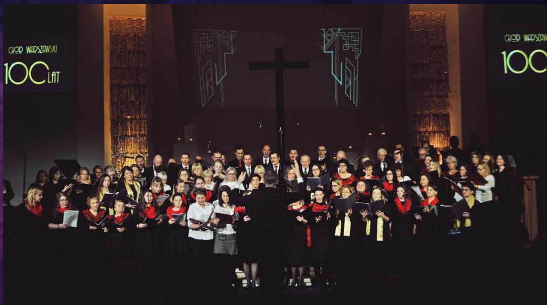
Chórzyści podczas koncertu przeglądu chórów baptystycznych – 07.12.2019 r.