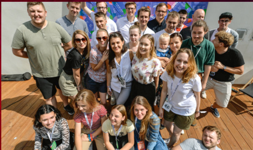
Młodzież ze zboru na Festiwalu Refresh