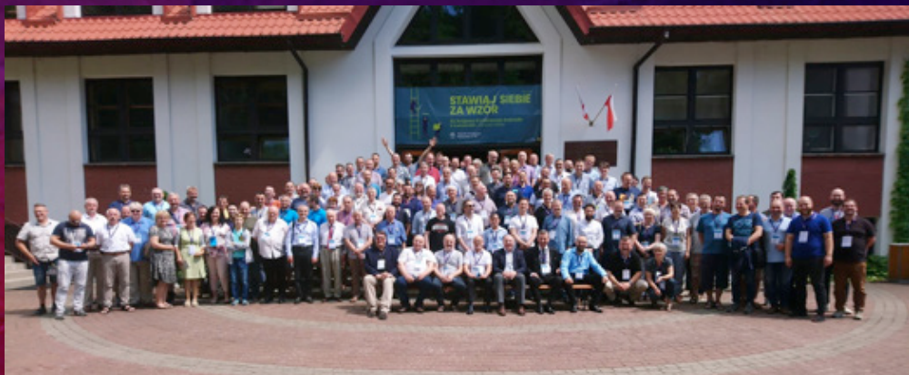
Zjazd XLI Krajowej Konferencji Kościoła, 07.06.2019 r., Warszawa - Radość